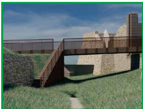
PASSERELLE D'ACCÈS POUR TOUS LES PUBLIC

Après avoir aménagé un circuit de visite des espaces naturels, le Conservatoire souhaite aujourd'hui rendre l'accès au public d'une partie des fortifications dans le respect de la sécurité des visiteurs et de la biodiversité présente.